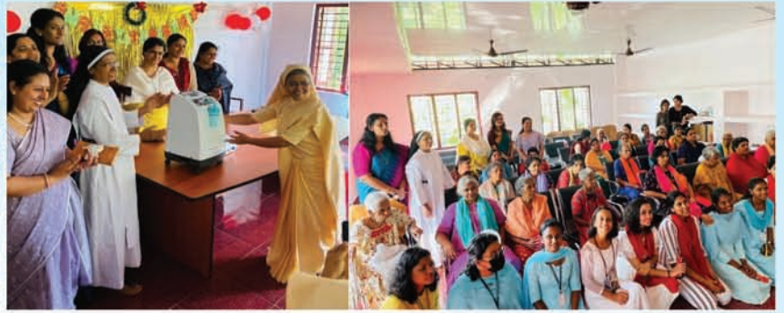
Donating an Oxygen Concentrator and Nebulizer to an hospice for terminally ill as part of 'Vimalaardham'