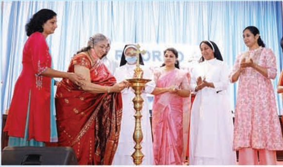
Annual Alumnae Reunion 2022