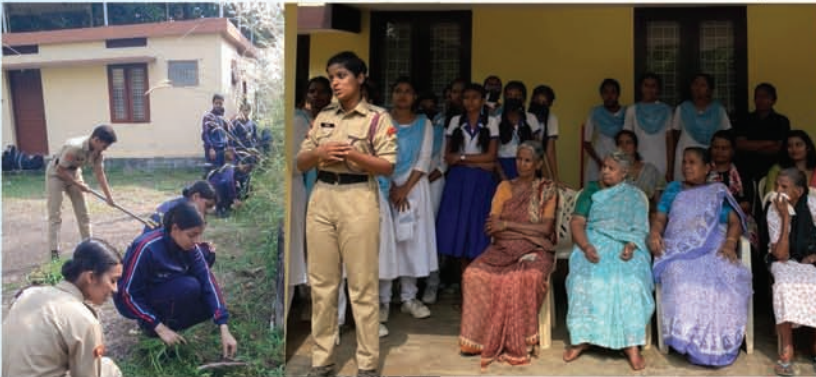
NCC cadets at the recreation hub for the aged, Pakalveedu, an Alumnae Community Outreach Initiative