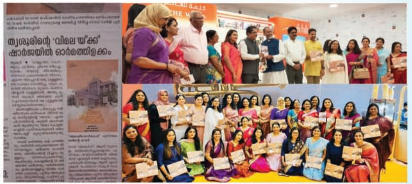
Release of the memoir 'Vimalameeyormakal' published by the UAE Vimala Alumnae chapter, VIMEX at Sharjah International Book Fair