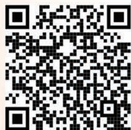
Alumnae Accolades 2023