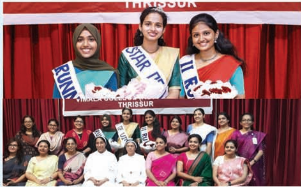
Star of Vimala Contest