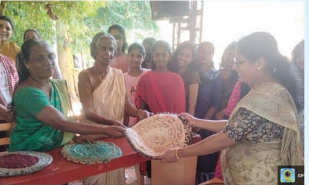
Stall of cloth products by inmates of 'Pakalveedu'